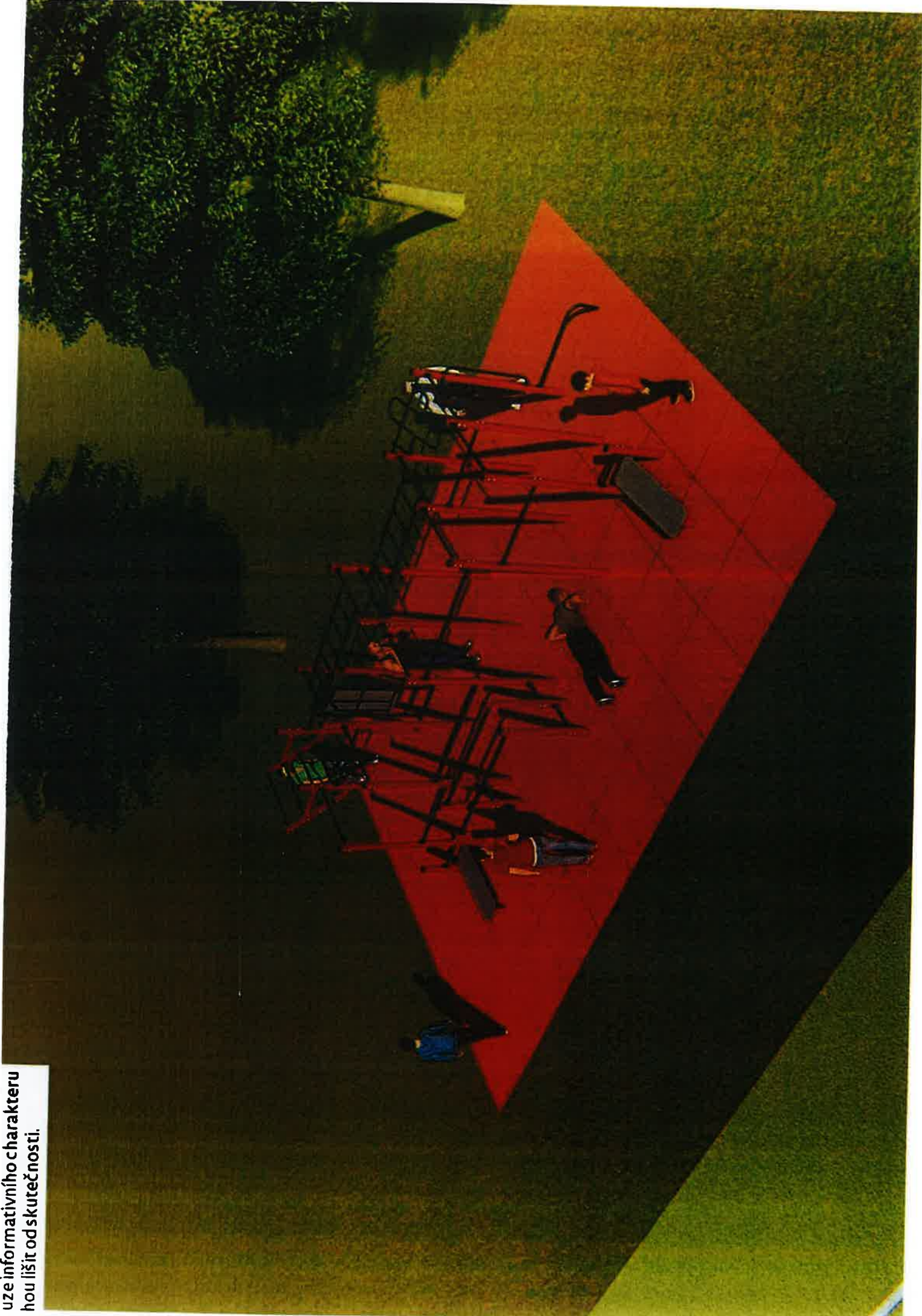
uze informativního charakteru hou lišit od skutečnosti.